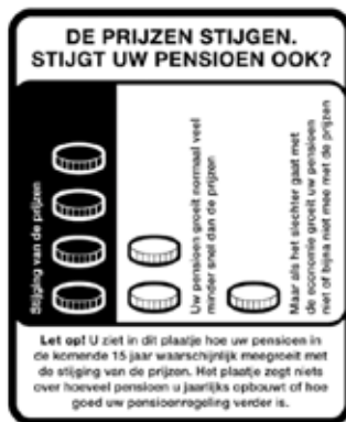
Toeslagenlabel gepensioneerden en oud-werknemers

salaris dat je aan het eind van je loopbaan verdient. Daarnaast wordt eventueel opgebouwd prepensioen en pensioen dat je opbouwt in de Shift jaarlijks onvoorwaardelijk geïndexeerd conform de reële inflatie. Je pensioen stijgt dus altijd voor 100% mee met de ontwikkeling van de prijzen.