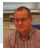
Marco van Beveren Pensioenbureau

Als de relatie met de partner eindigt, behoudt de ex-partner recht op partnerpensioen. De hoogte van dit partnerpensioen wordt berekend op basis van het partnerpensioen dat is opgebouwd tot aan het moment dat de partnerrelatie formeel is beëindigd. Na beëindiging van de relatie wordt het pensioen waarop de ex-partner recht heeft overigens 'bijzonder partnerpensioen' genoemd. ■